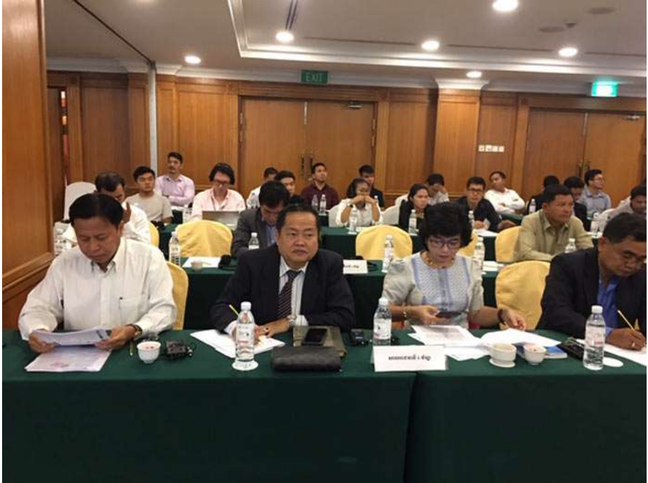
( http://kampuhealthmey.com/2016/wp-content/uploads/2019/11/T-11-26-19-14-full.jpg )