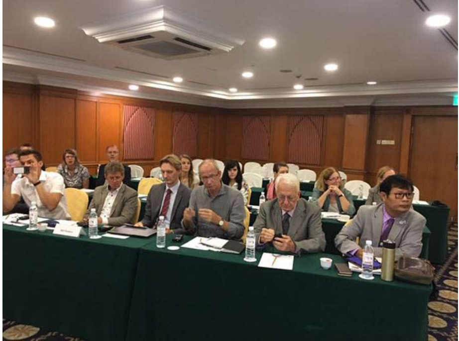
( http://kampuhealthmey.com/2016/wp-content/uploads/2019/11/T-11-26-19-15-full.jpg )