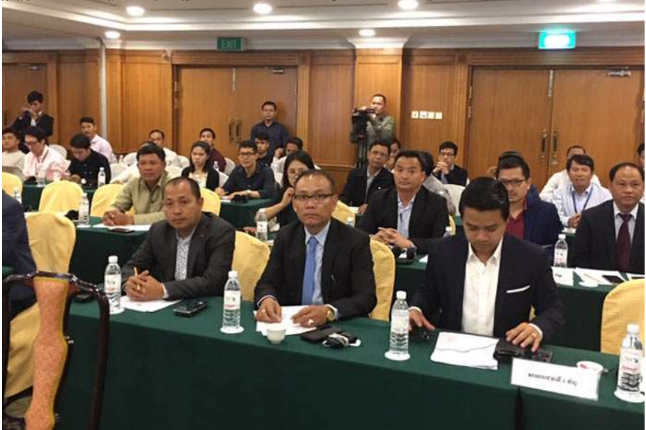
( http://kampuhealthmey.com/2016/wp-content/uploads/2019/11/T-11-26-19-16-full.jpg )

លោកបន្តថា សម្រាប់រាជធានីភ្នំពេញ យើងបានធ្វើការស្រាវជ្រាវ ក៏ដូចជាយកទឹកចេញពីរាជធានី ក្នុងមួយឆ្នាំសម្រាប់ការ ប្រមាណជា ៥ លានដុល្លារ ខណៈដែលយើងទទួលបានប្រាក់ ពីប្រជាពលរដ្ឋលើការងារនេះ បានប្រមាណតែ ៥ លាន ដុល្លារតែប៉ុណ្ណោះក្នុងមួយឆ្នាំ។