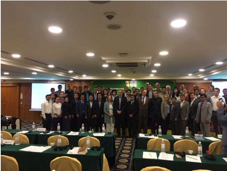
( http://kampuhealthmey.com/2016/wp-content/uploads/2019/11/T-11-26-19-11-full.jpg )