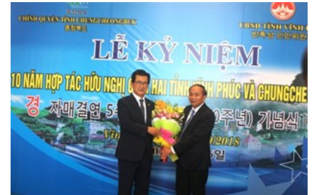
Vinh Phúc kỷ niệm 10 năm hợp tác hữu nghị với tỉnh Chungcheongbuk Hàn Quốc

Vinh Long: Mong muốn quan hệ hợp tác với Nhật Bản tiếp tục phát triển mạnh mẽ