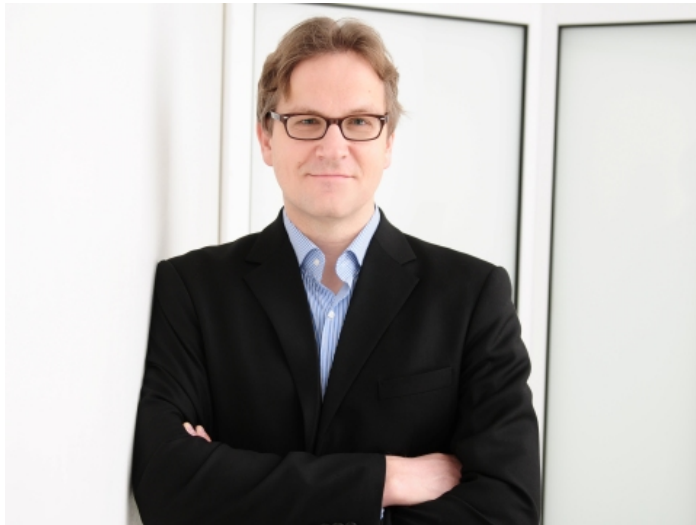
Tiến sĩ Michael Waibel.

Trong mắt nhà địa lý học người Đức, sức hút của Hà Nội không nằm ở những tòa nhà cao tầng, mà là ở sự pha trộn đầy cuốn hút của những nền kiến trúc khác nhau, gắn với từng giai đoạn lịch sử. Tất cả đều được ôm trọn trong một thành phố đang chuyển mình năng động.