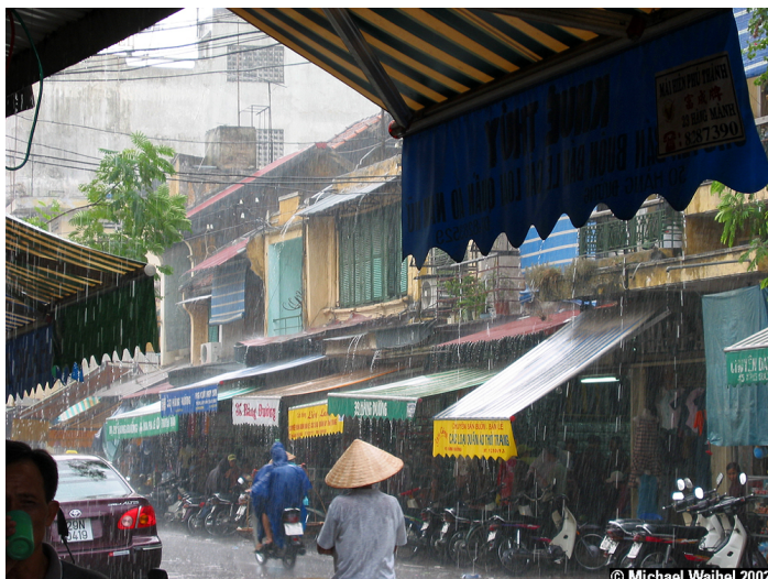
Phố Hàng Đường ngày mưa.

Ông vẫn miệt mài đi về giữa Đức và Việt Nam để hoàn thành dự án nghiên cứu về chất lượng không khí trong các tòa nhà và thúc đẩy việc sử dụng vật liệu xây dựng bền vững.