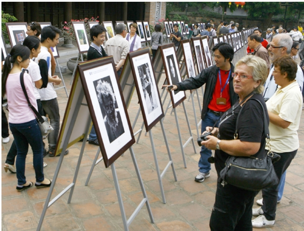
(/cdn/vn/media/k2/items/src/2765/c321c3f37c360e8061e8f1ee6b4f06c7.jpg)Triển lãm nghệ thuật ngoài trời giúp kết nối và thu hút đông đảo công chúng trong và ngoài nước thưởng lãm.