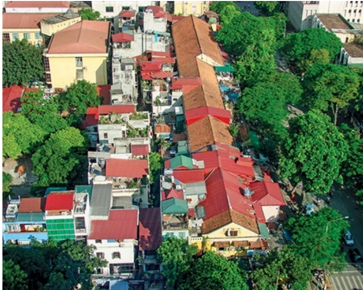
La rue Ly Thuong Kiet, dans l'arrondissement de Hoàn Kiếm, vue du ciel. Photo: CVN.

David Frogier De Ponlevoy, un professeur de journalisme qui a passé huit ans à Hanoi, a été très touché par l'image de cette vendeuse ambulante à côté de sa bicyclette encombrée de légumes dans des rues au trafic surréaliste. Bien que Hanoi et son agglomération connaissent aujourd'hui une urbanisation extrêmement rapide, elle conserve encore les traits d'un «grand village».