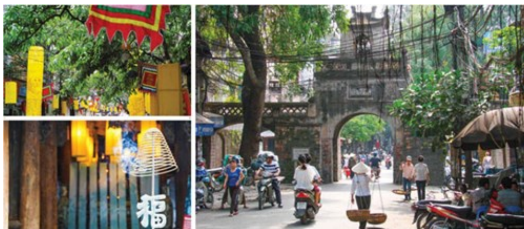
Hà Nội với

về không gian và tiến trình phát triển đô thị tại Hà Nội và cả TP.HCM. Để có được 600 bức ảnh từ trên cao trong cuốn “Hà Nội - Capital City” là một thử thách không nhỏ với ông và cộng sự. Các bức ảnh được chụp từ nóc 25 công trình cao tầng và 6 chuyến “không du” dọc ngang thành phố bằng những thiết bị điều khiển từ xa hiện đại.