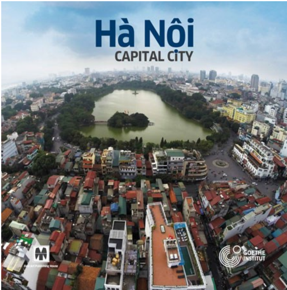
Bìa cuốn sách “Hà Nội - Capital City”

lớn” mà ông cho rằng, đó quả thực là một điều may mắn.