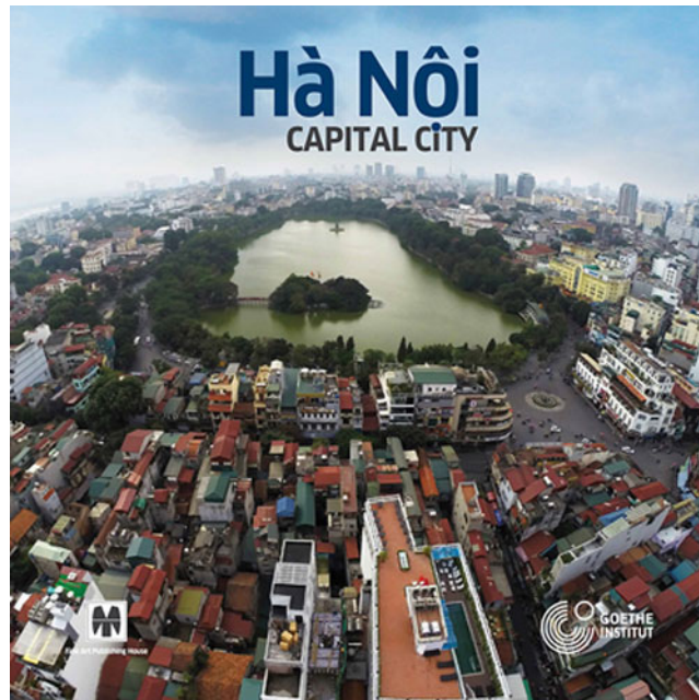
Cuốn sách "Hà Nội-Thành phố Thủ đô".

Với kinh nghiệm làm việc, nghiên cứu, giảng dạy và đảm nhận các dự án về phát triển đô thị, TS Mai-cơn Guây-bơ cùng cộng sự đưa người xem qua lăng kính muôn màu để có thể hình dung được "bức tranh" về Hà Nội-Thành phố Thủ đô.