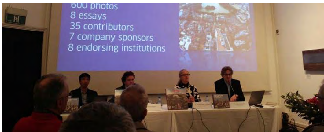
Buổi ra mắt sách "Hà Nội Capital City"