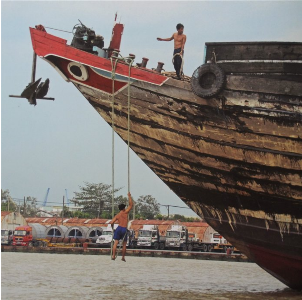
Phà cập bến sông Sài Gòn, một bức ảnh của Henning Hilbert thực hiện năm 2013, in trong TP.HCM - Mega city.

“Đối với rất nhiều người, đại đô thị là miền đất hứa hẹn một tương lai tốt đẹp hơn, một cuộc sống mới sung túc. Nhưng liệu những giấc mơ này có thể được thực hiện khi số dân của thành phố tăng lên một vài triệu và biến đổi khí hậu đã làm cho một phần thành phố thường xuyên ngập trong nước?”, theo lời mở đầu.