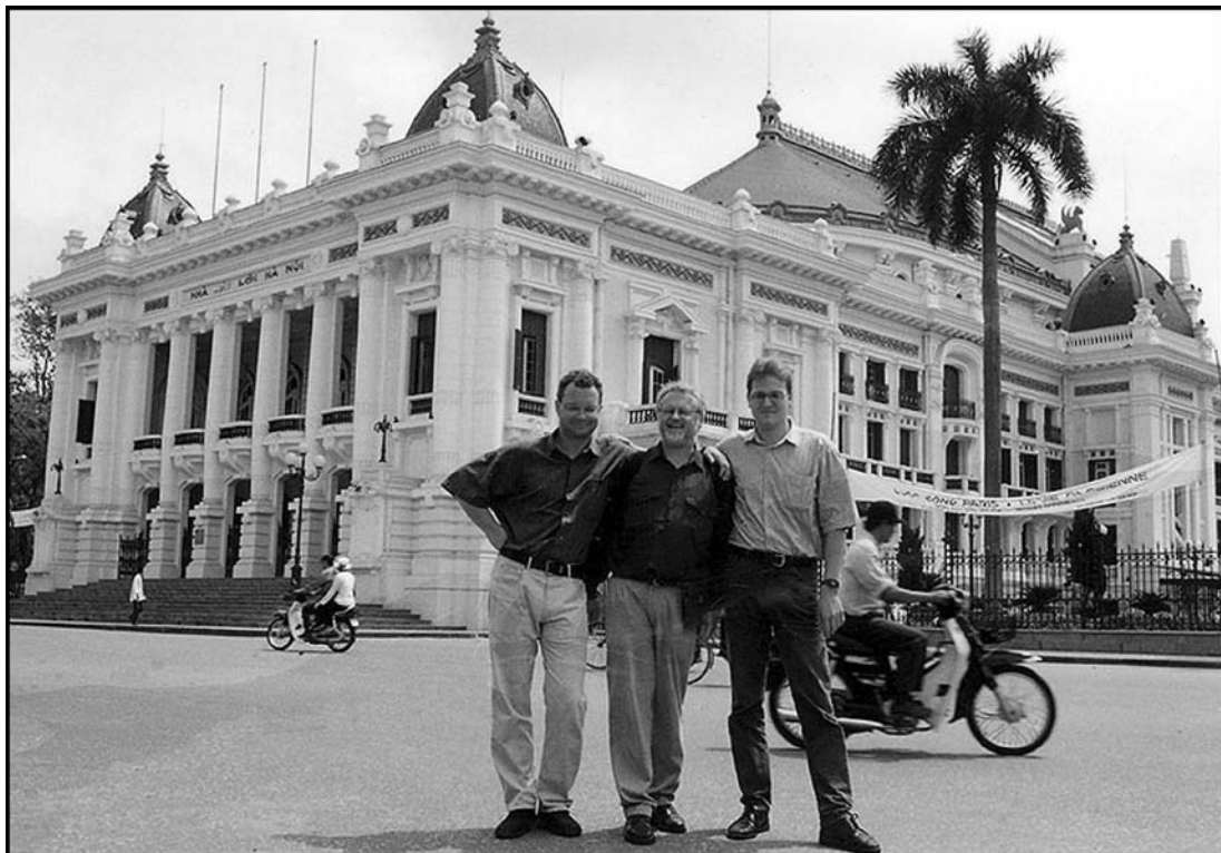
Abb. 2: Deutsche Touristen vor dem berühmten Stadttheater Hanois (Aufnahme: B. Kreisel, 1998)

Der touristische Boom der letzten beiden Jahrzehnte führte auch zu einer massiven Veränderung der Herkunftsländer der internationalen Touristen. Noch im Jahr 1993 etwa stellten Besucher aus den USA den stärksten Anteil (27 % aller int. Ankünfte), gefolgt von Besuchern aus Taiwan (14 %) und Frankreich (11 %). Die hohen Anteile der Touristen aus den USA und Frankreich in der ersten Hälfte der neunziger Jahre lassen sich darauf zurückführen, dass sehr viele Auslandsvietnamesen (Viet Kieu) sowie Kriegsveteranen und ihre Angehörigen Vietnam besuchten. In der ersten Jahreshälfte 2004 hingegen stammten die meisten Besucher aus dem benachbarten China (28 %), gefolgt von den USA (10 %), Taiwan (9 %) und Japan (8 %). Deutschland (vgl. Abb. 2) stellte in den ersten sechs Monaten des Jahres 2004 mit 27.433 Besuchern (2 % aller int. Ankünfte) nach Frankreich (3,6 %) und Großbritannien (2,5 %) das dritt wichtigste europäische Herkunftsland dar.