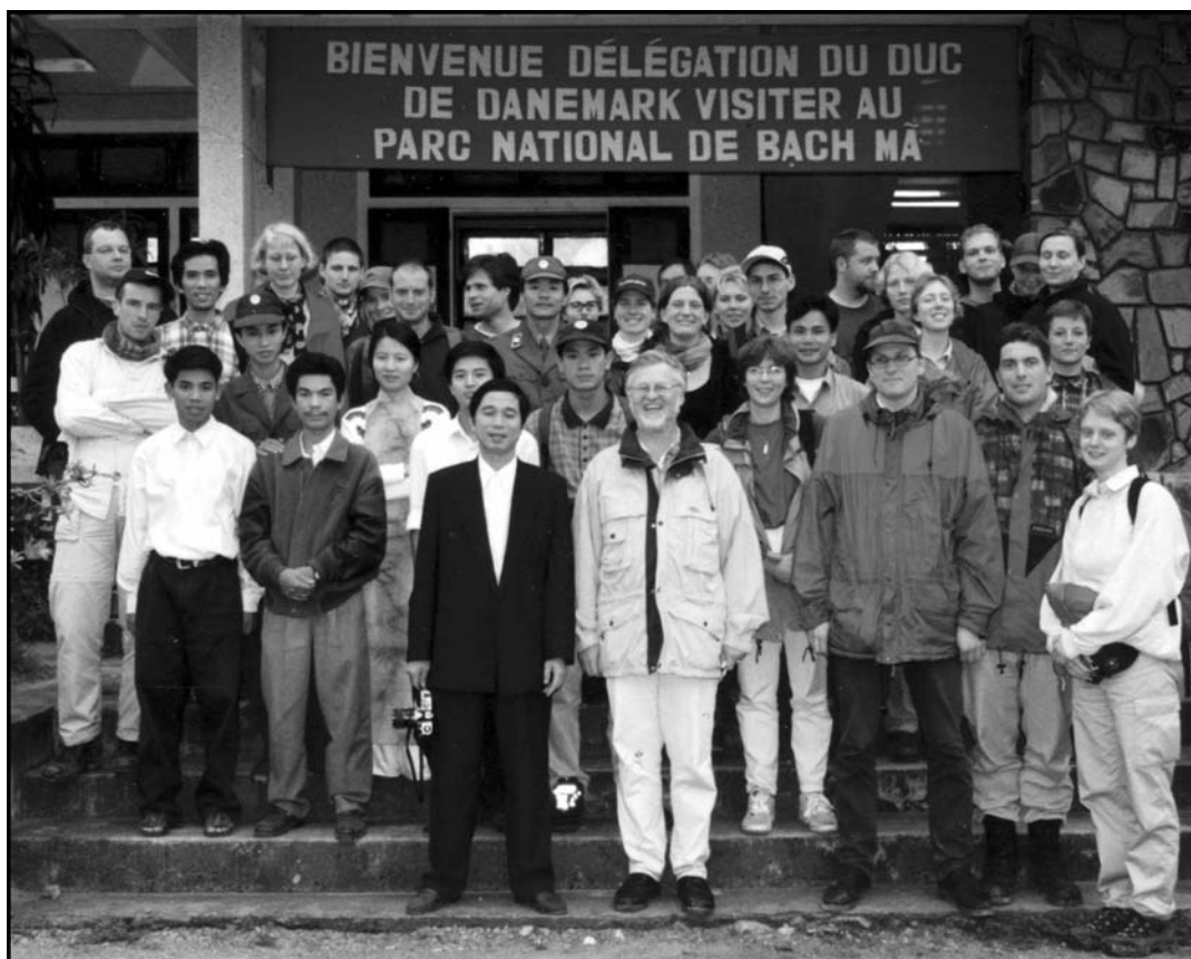
Abb. 5: Exkursionsgruppe des Geographischen Instituts der Universität Göttingen im Bach Ma National Park, Vietnam