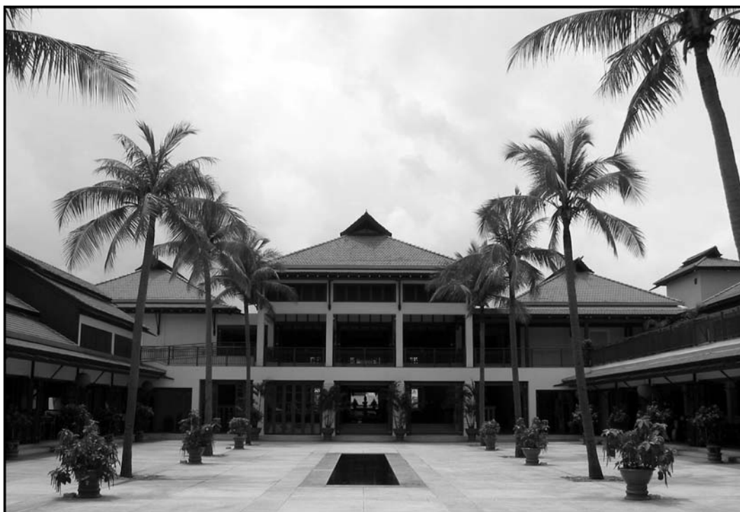
Abb. 4: Das 1997 am China Beach bei Danang errichtete Furama Resort Danang war die erste 5-Sterne Strandunterkunft Vietnams (Eigene Aufnahme, 2004).

Areal zwischen den Fischerorten Phan Thiet und dem mit Sanddünen bestückten Ort Mui Ne erfahren, das sich zu einer beliebten Destination hauptsächlich von Pauschalurlaubern entwickelt hat.