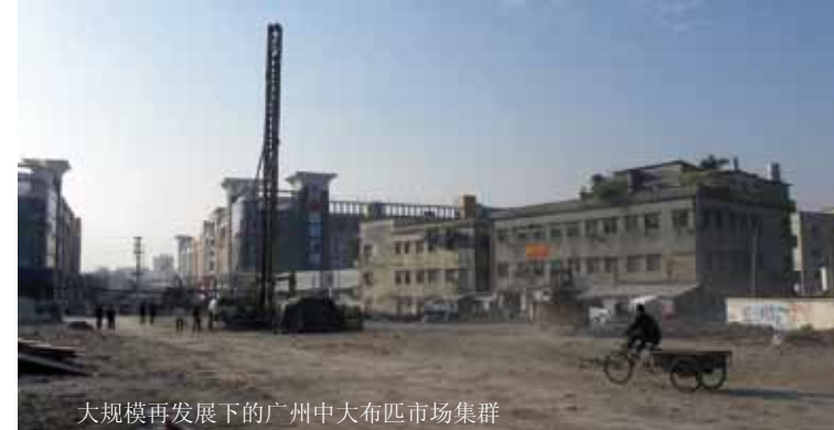
大规模再发展下的广州中大布匹市场集群