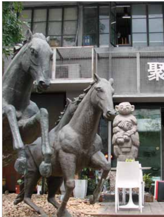
深圳OCT当代艺术中心