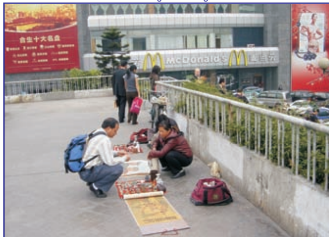
Informal Trader on a Pedestrian Bridge in Guangzhou 2006

边界是指划分空间和群体的界限。我们将从过国家和地区的不同层面同时观察正规和非正规边界，并把所有这些边界都视作为一种社会构建，反映了不断变化的政治、社会经济和文化条件。边界不仅在土地管理和规划上起作用，而且对于居住在该区域内的人民来说也是极具意义的。我们的研究方法将从两个方面出发：“自上而下”和“自下而上”。