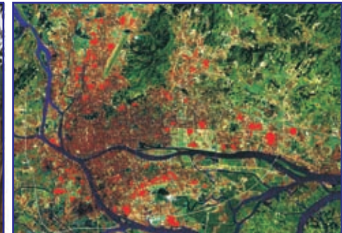
Urban villages (red) in the heart of Guangzhou

包括街区不同社会层面、不同建筑构造的各种住宅群体（城中村、住宅小区、封闭居住区）