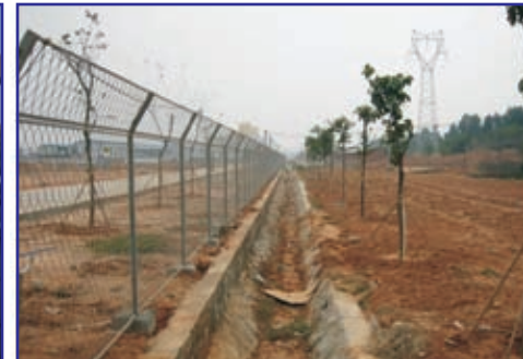
Factory compound surrounded by a fence in Guangzhou