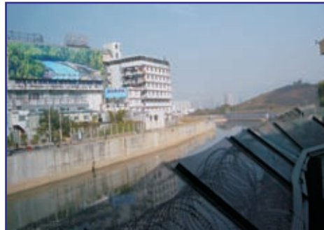
Border between Hong Kong SAR and the Shenzhen SEZ

与中国中央行政结构并行的、旨在建立一定程度的自治组织和自治区域（特别行政区（SAR）；经济特区（SEZ））